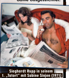
Nach seinem Ausstieg beim „Tatort“ spielte Sieghardt Rupp hauptsächlich Theater

Nach dem „Tatort“-Ausstieg spielte Rupp meist Theater. Er wurde für seine Darstellung des Darigenten Wilhelm Furtwängler 1997 mit der Kainz-Medaille ausgezeichnet.